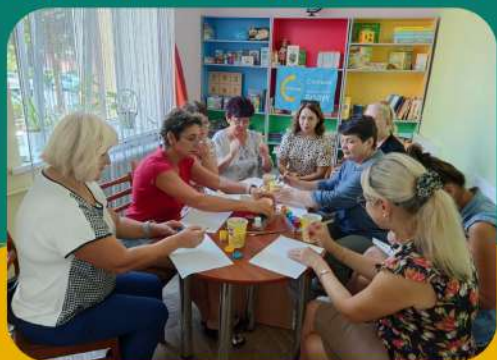
Проект "Поруч", програма "Діти і війна. Техніки зцілення" (навчання вчителів)