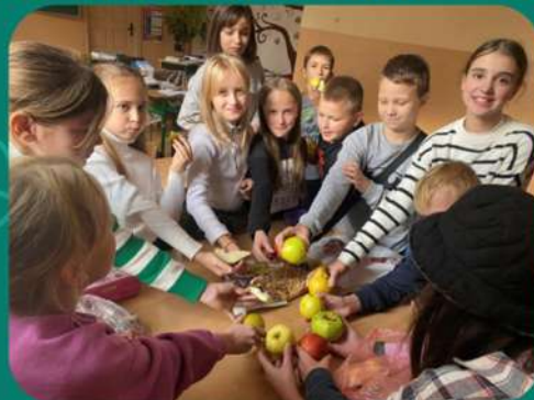
Проект "5 кроків до здорового харчування за підтримки "World Health Organization Ukraine"