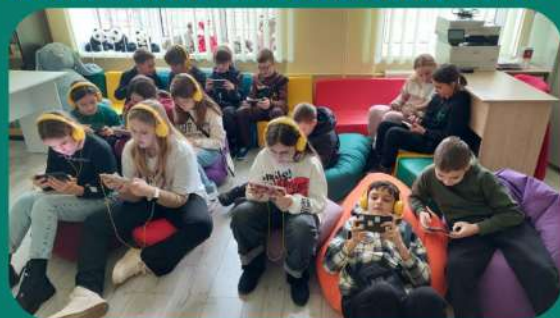
Плотний проєкт "Triumf Health for Ukraine" (Естонія), мобільний застосунок "Triumfland Saga"