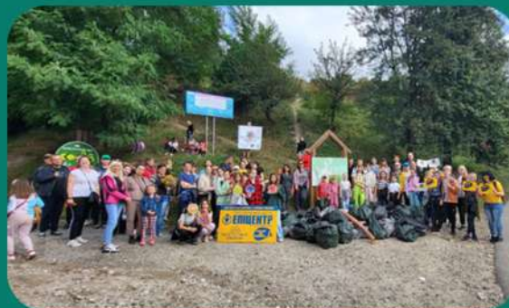
Проект «Всесвітній день прибирання World Cleanup Day 2023 в Україні»