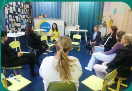
Проект "Поруч" за програмою "Батьківство без стресу" (UNICEF)