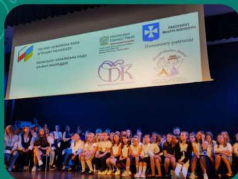
Щорічний освітній проєкт «Po obu stronach Karpat»

Департамент освіти Івано-Франківської міської ради